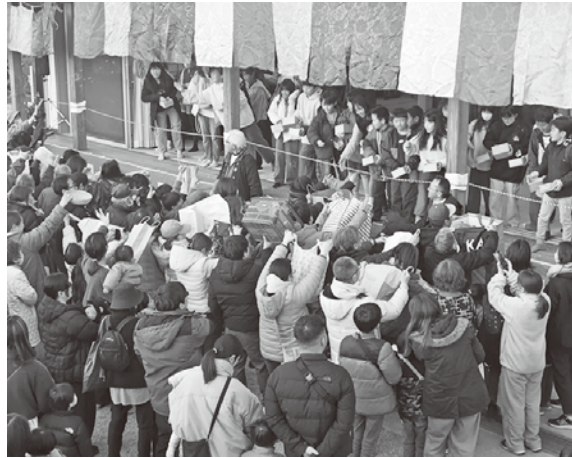
ご来場いただいた全てのお子様も壇上から豆を撒きます。

立春の節分は旧暦においては新しい年の始まりとされており、新年の無病息災や五穀豊穡などを祈願する日でもあります。豆（魔滅）を投げて鬼を払い、この一年の安寧をお祈り致しました。