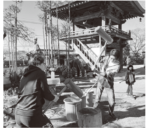
お餅つきは、若いボランティアさんが頑張りました。

お餅と一緒に振る舞われたのは、スタッフさんが作ってくださった豚汁です。温かい一杯が冷えた体に染み込みました。みんなの笑顔があふれる中、お餅も豚汁もみんなで完食しました。