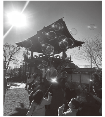
青梅在住のシャボン玉アーティストの方が境内でシャボン玉をたくさん飛ばしてくれました。

ふわふわふわ冬の澄みきった青空に浮かんでいました。その幻想的な光景のシャボン玉を、子どもたちは夢中になって追いかけてました。そばから見ている心が和む幸せな時間でした。