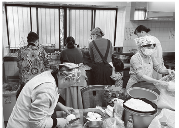
料理はおよそ100人分。台所に活気みなぎっています。

分からないことがある時は、AIに聞けばすぐに答えがわかる現代ですが、子どもたちは想像力を働かせ、自分で考え自分なりの解を見つけ行動しています。SNSやAIがどんどん生活に入ってくる時代ですが、子どもたちを見てみると、まだまだ未来は頼もしいなと感じるてらこやでの時間です。